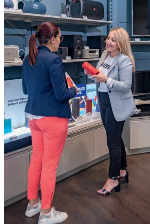
^ La gestionnaire quitte parfois son écran pour se rendre au showroom et y conseiller des clients.

La jeune femme entretenait de nombreux contacts avec le département achats de son entreprise. «Je devais par exemple clarifier la disponibilité et les délais de livraison d'un produit. Il arrivait aussi que les clients soumettent eux-mêmes des idées pour compléter notre assortiment.